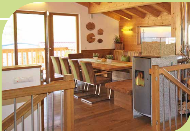
ALPIN LOFT MIT KAMINOFEN