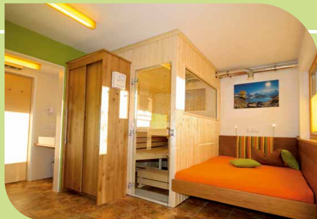
SONNENRAUM MIT SAUNA