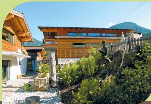
Alle Bilder dieser Seite - ALPIN CHALET Classic