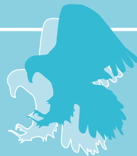
ALPIN ATRIUM MIT TV